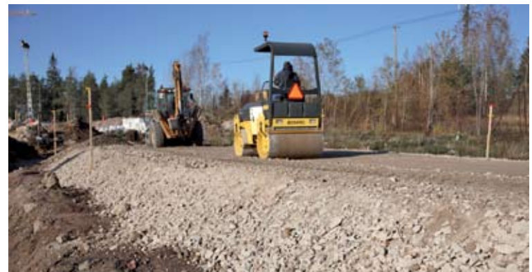
Betonimurske korvaa tienrakentamisessa luonnonsoraa ja säästää ympäristöä.

Betonin maarakennuskäytöllä on tällä hetkellä hyvä toimintaympäristö Suomessa. Murskeen käyttö on hyvin ohjeistettu ja sen käytöstä on laaja kokemus. Muista aineista ja materiaaleista vapaa betonimurske ei myöskään aiheuta ympäristöriskejä. Betonimurskeen hinta on 20–30 prosenttia halvempi kuin luonnonSORAN.