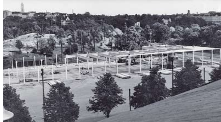
Suomen Messujen Kansojen Halli Helsingin Messukentällä oli vuonna 1962 Suomen suurin elementtirakennus.

Purkutyömaiden betonimurskeelle on järjestetty laadunvarmistus, jossa tutkitaan määrävälein mahdollisten haitallisten aineiden pitoisuus ja liukoisuus ympäristöön. Betonissa itsessään ei ole pääsääntöisesti ympäristölle haitallisia aineita, mutta varmistukset tehdään muiden materiaalien ja pinnoitteiden takia,